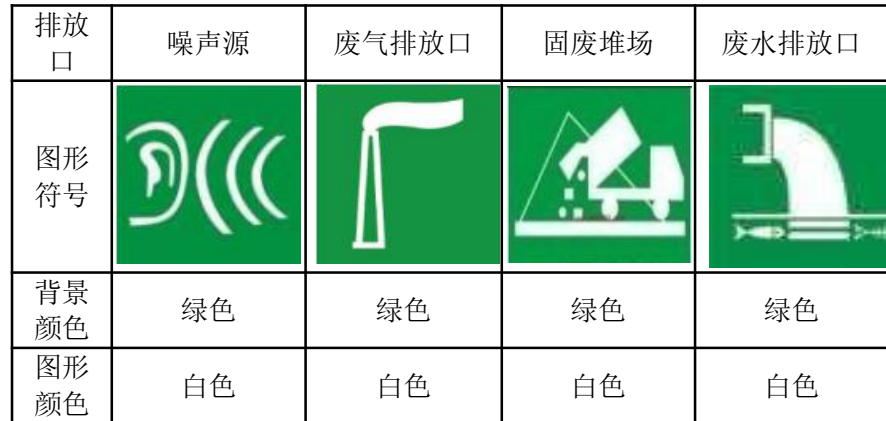
表5-1 环境保护图形标志一览表

要求各排污口（源）提示标志形状采用正方形边框，背景颜色采用绿色，图形颜色采用白色，警告标志采用三角形边框，背景颜色采用黄色，图形颜色采用黑色，标志牌应设在与功能相应的醒目处，并保持清晰、完整。