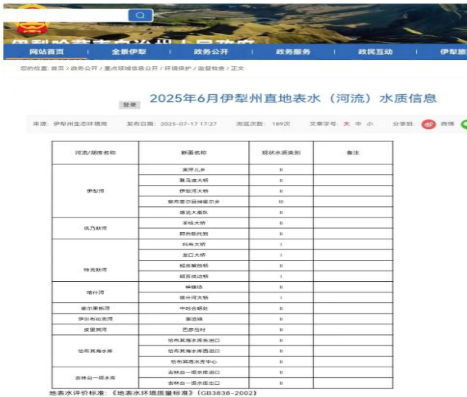
图 3-1 2025 年 6 月伊犁州直地表水（河流）水质环境质量现状